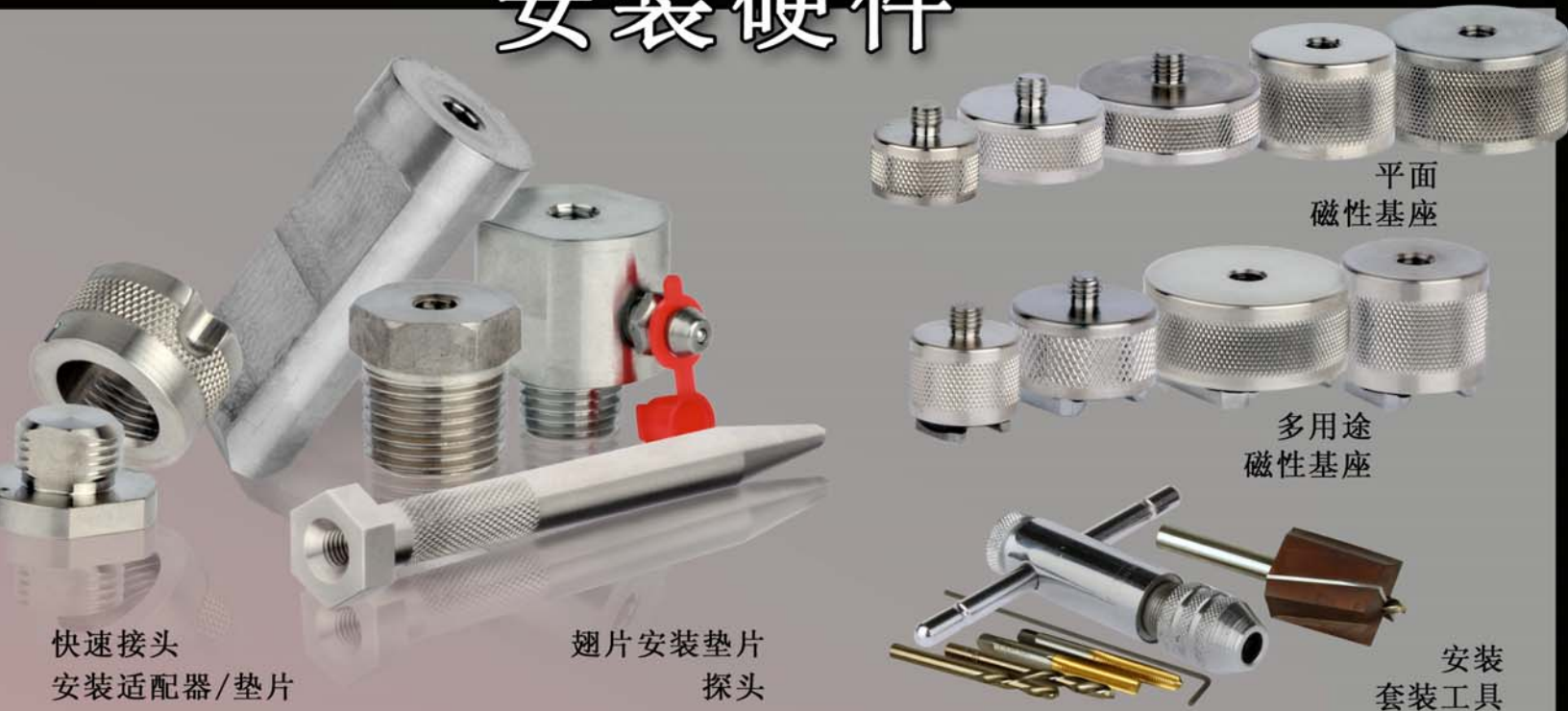
快速接头 安装适配器/垫片